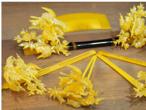
花筭（はなこうがい）