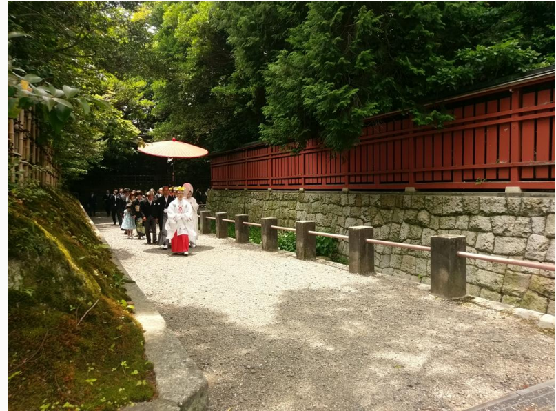
参集所から本殿までの参進の儀